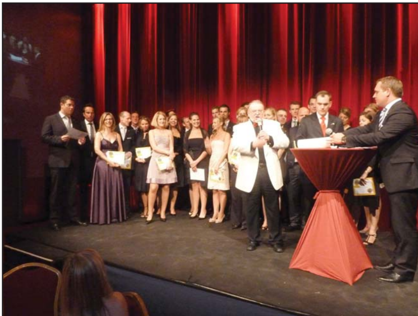
Es ist soweit - die Charterurkunde wird unterschrieben.