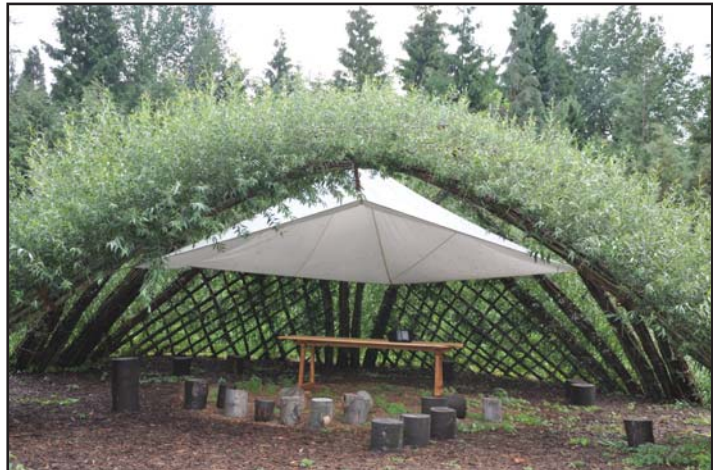
Fertig! Der Außenarbeitsplatz steht.

Grundsätzlich werden die Programme rund um das Thema Wald komplett »outdoor« durchgeführt. Für wetterbedingt notwendige Umplanungen steht ein Seminarraum zur Verfügung. Eine deutlich größere Flexibilität und eine Erweiterung in den angebotenen Themen und der