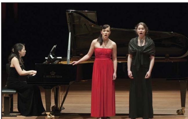
Die Künstler begeisterten das Publikum