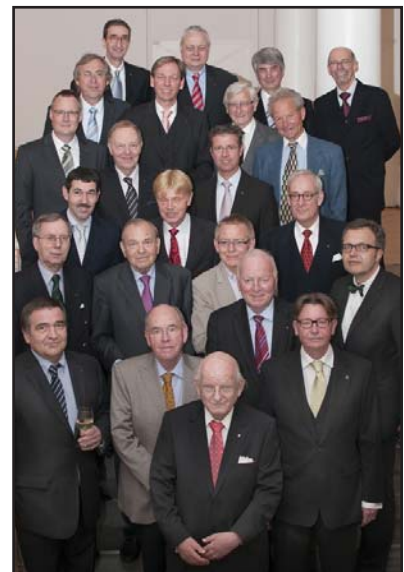
Wir sind Essen Werethina

Die gebotenen Leistungen der Solisten, Angehörige der Theaterklasse und Studenten der 2.-4 Jahrgänge, die mit gekonnt schauspielerischem Apercus und großer Verve ihren Part vortrugen, waren durchweg überzeugend, zum Teil sehr beeindruckend und auf einem