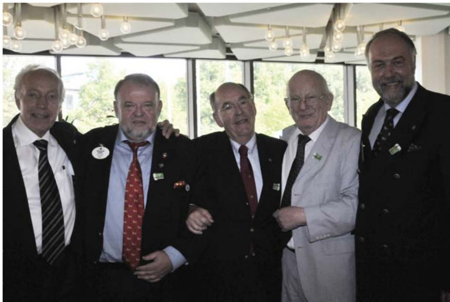
WR-ler sind immer aktiv dabei!