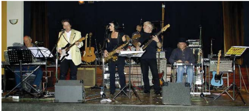
Band Bielefeld Ahoi rockt ab

Sie ist ein Leben wie aus Wirtschaftswunderbüchern gewöhnt, in einer italo-katholischen Großfamilie an der Wittener Stadtgrenze in Dortmund-Persebeck aufgewachsen.