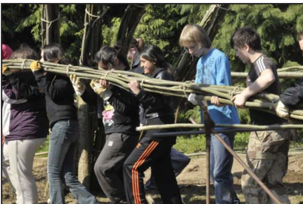
Wir schaffen das! Schüler packen kräftig an.

Durchführung von Programmen hat das Vorhandensein eines Außenarbeitsplatzes mit sich gebracht.